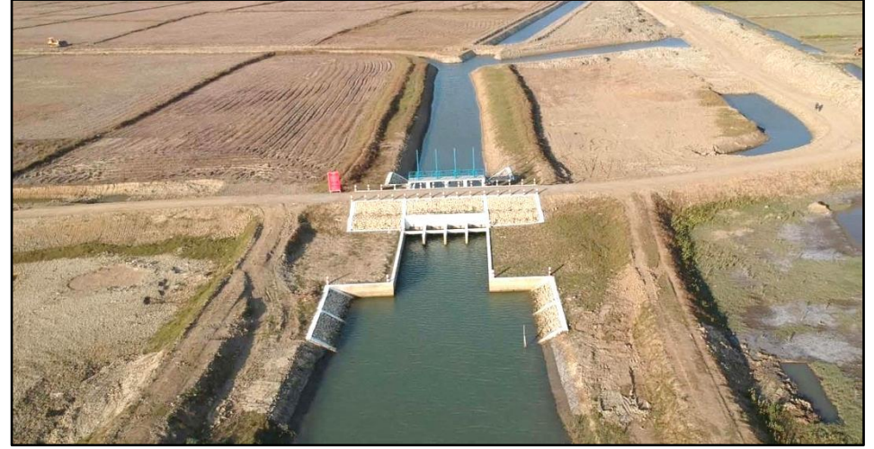
ကံကြီးစုရေတံခါး (၆ပေx၆ပေ)(၃)ပေါက် ဆောင်ရွက်ပြီးစီးမှု မှတ်တမ်းဓာတ်ပုံများ